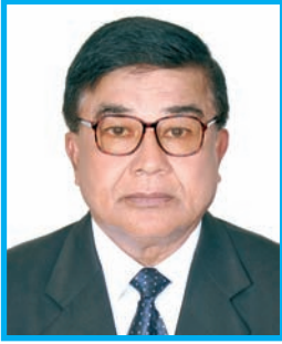
केदारमान कर्माचार्य संचालक